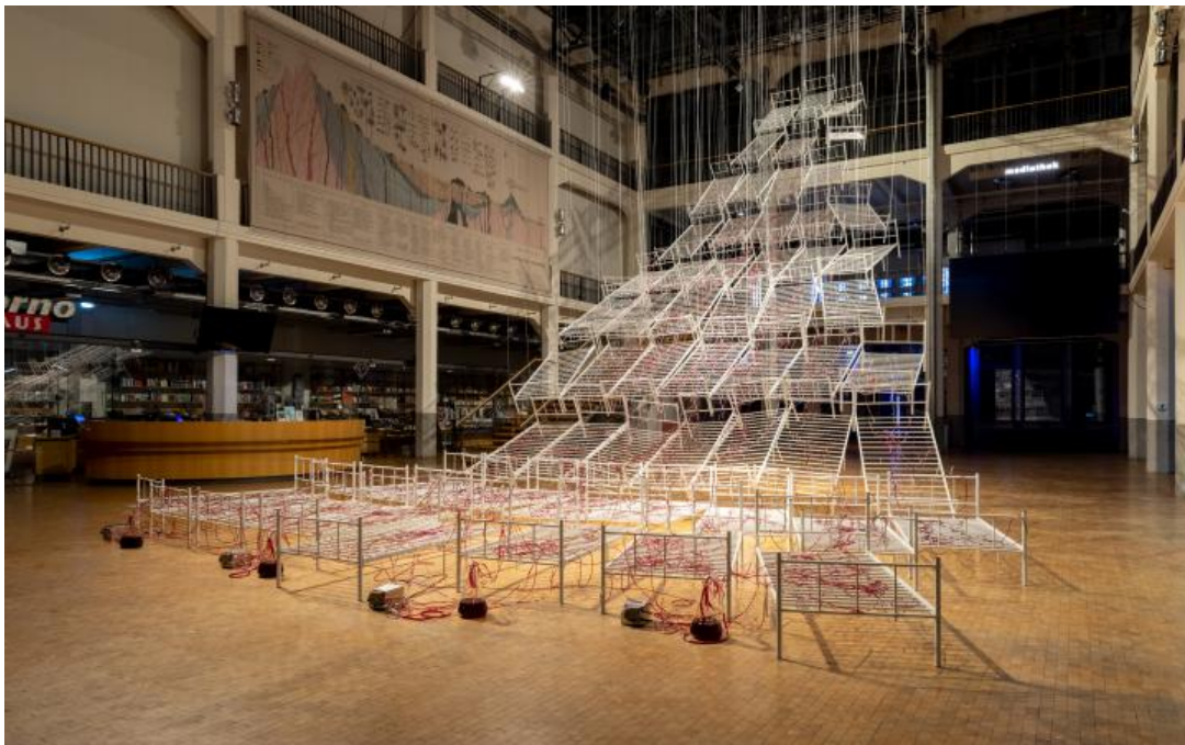
Foto: © Chiharu Shiota. Connected to Life, VG Bild-Kunst, Bonn, 2021, Installationsansicht. Foto: ZKM | Zentrum für Kunst und Medien Karlsruhe, Felix Grünschloß

verwandelt Bildhauer Tony Cragg Bewegung und Materie in Kunst – und diese braucht Platz! Gegründet hat er dafür den Skulpturenpark Waldfrieden in Wuppertal. Klar, dass es dort zum 100. Geburtstag von Beuys die passende Ausstellung gibt: „Joseph Beuys. Perpetual Motion“ läuft noch bis zum 20. Juni. Der Besuch der Beuys-Ausstellung ist nur mit einem tagesaktuellen negativen Corona-Test möglich. Hinweis vom Skulpturenpark Waldfrieden: „Besucher ohne Test können nur das Freigelände des Skulpturenparks besichtigen und erhalten deshalb einen Nachlass von 2€ auf den regulären Ticketpreis.“ Alle weiteren Infos zur Ausstellung und dem Gelände gibt es auf der Website vom Skulpturenpark Waldfrieden .