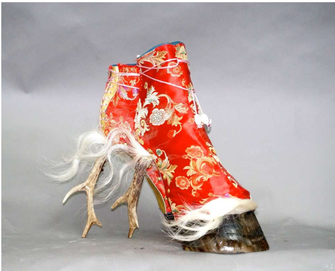
Iris Schieferstein Chinese Lyric, 2014

Zwischen Natur und Technik: Wenn immersive Welten entstehen, waren Medienkünstler*innen am Werk – zu erleben in der Ausstellung „Verführung Licht. Medienkunst im Dialog mit Natur und Gesellschaft“ im Staatlichen Museum Schwerin. Übrigens für alle Altersgruppen, denn Hüpfen, Springen und Tanzen sind in dieser Ausstellung ausdrücklich erlaubt! Die Ausstellung läuft noch bis zum 3. Oktober. Ein Museumsbesuch ist mit vorheriger Anmeldung möglich. Wichtiger Hinweis: Ab dem 6. April müssen Besucher*innen ein tagesaktuelles negatives COVID-19-Schnell- oder Selbsttest-Ergebnis vorweisen. Alle Infos gibt auf der Website vom Staatlichen Museum Schwerin