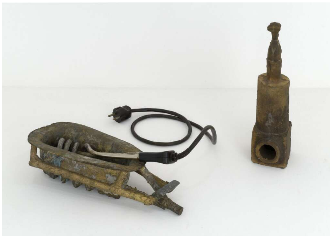
Joseph Beuys, Badewanne für eine Heldin, 1984 Bathtub for a Heroine, 1984, Galerie Thaddaeus Ropac, London/Paris/Salzburg

Weitere Infos zur Ausstellung gibt es auf der Website der Ludwiggalerie Schloss Oberhausen